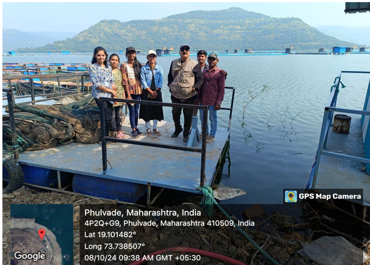
Photo 3:- During the discussion about the types of gears and crafts use in fishing.