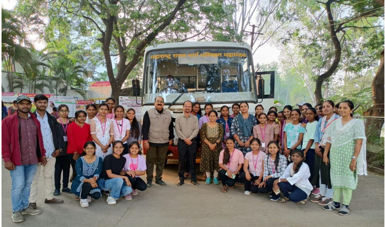
Photo 1:- Beginning of the journey towards the study destinations.