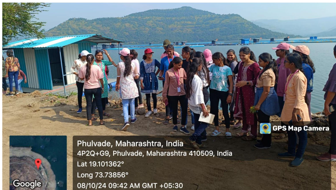
Photo 4:- Students are enjoying the breathtaking view of Dimbhe Dam Backwater.