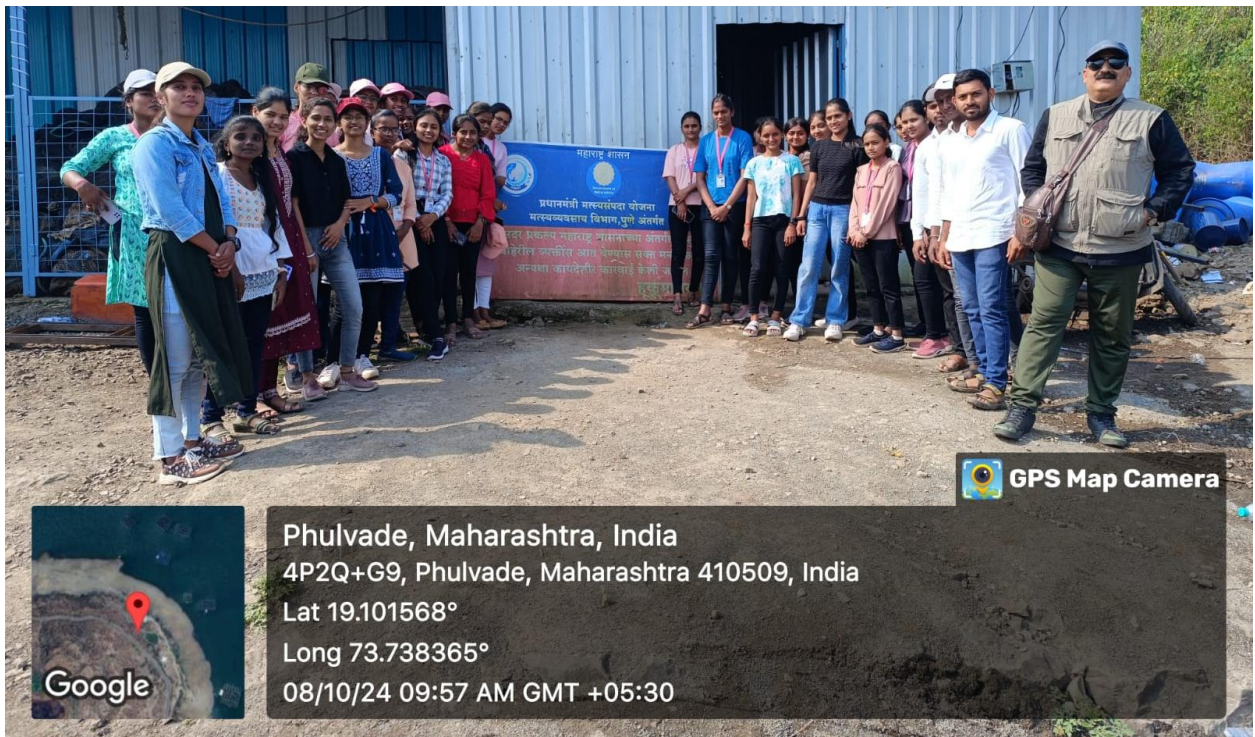
Photo 2:- After reach at the study destination of Dimbhe dam backwater fishery.