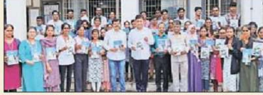
राजगुरुनगर : येथील हुतात्मा राजगुरु महाविद्यालयात मराठी विभागाच्या वतीने आयोजित वाचनवाटा उपक्रमा अंतर्गत दिवाळी अंकाचे प्रकाशन करण्यात आले.