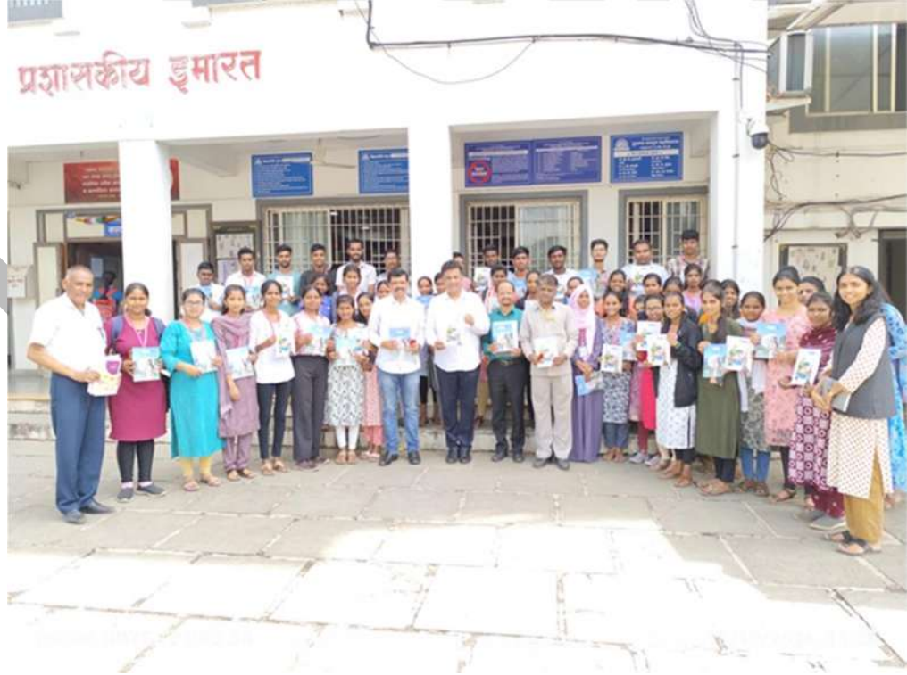
दिवाळी अंकासह विद्यार्थी व मान्यवर अध्यक्ष साहेब