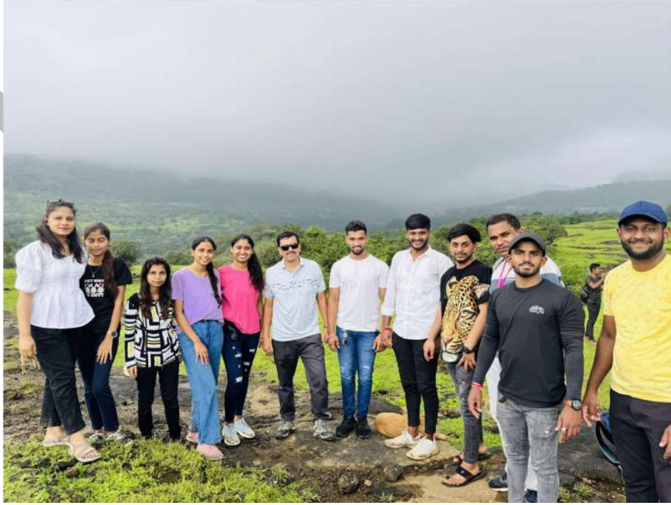
भोरगिरी – भीमाशंकर वनसचेतन शिबीर