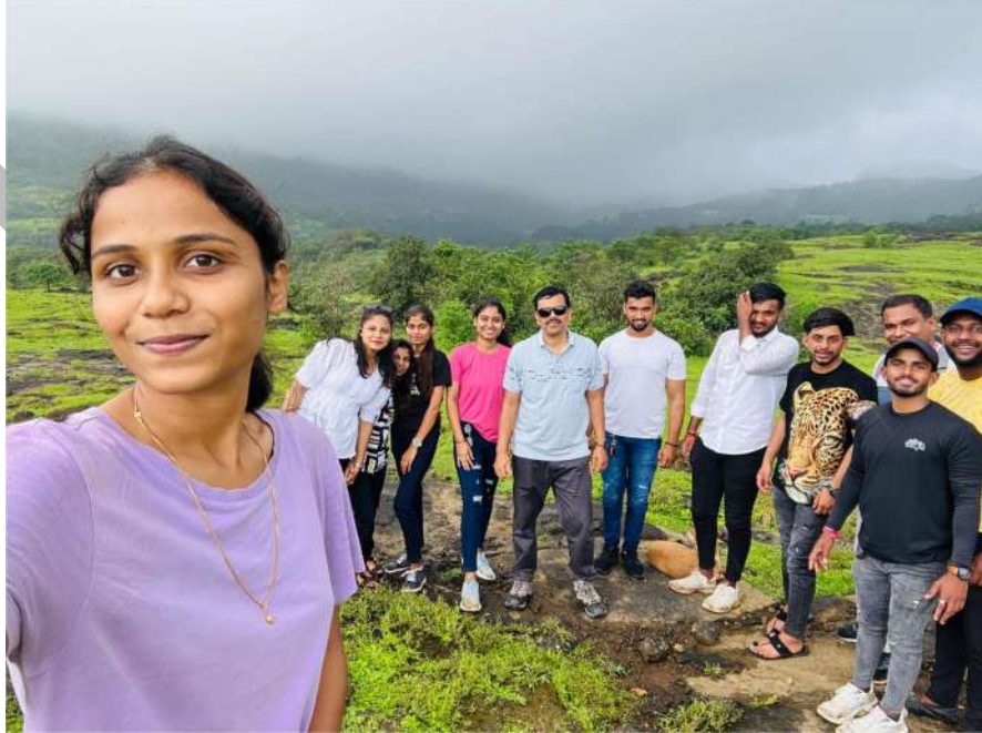
भोरगिरी – भीमाशंकर वनसचेतन शिबीर