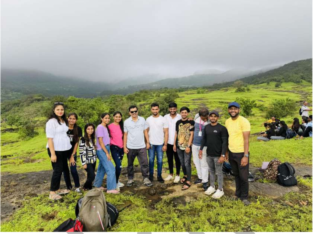
भोरगिरी – भीमाशंकर वनसचेतन शिबीर