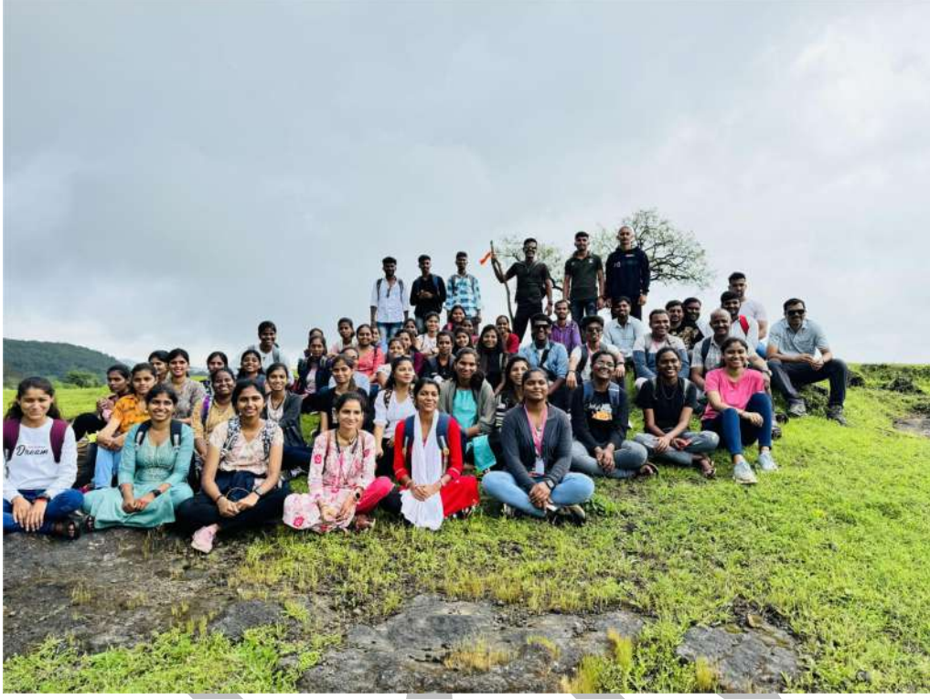
भोरगिरी – भीमाशंकर वनसचेतन शिबीर